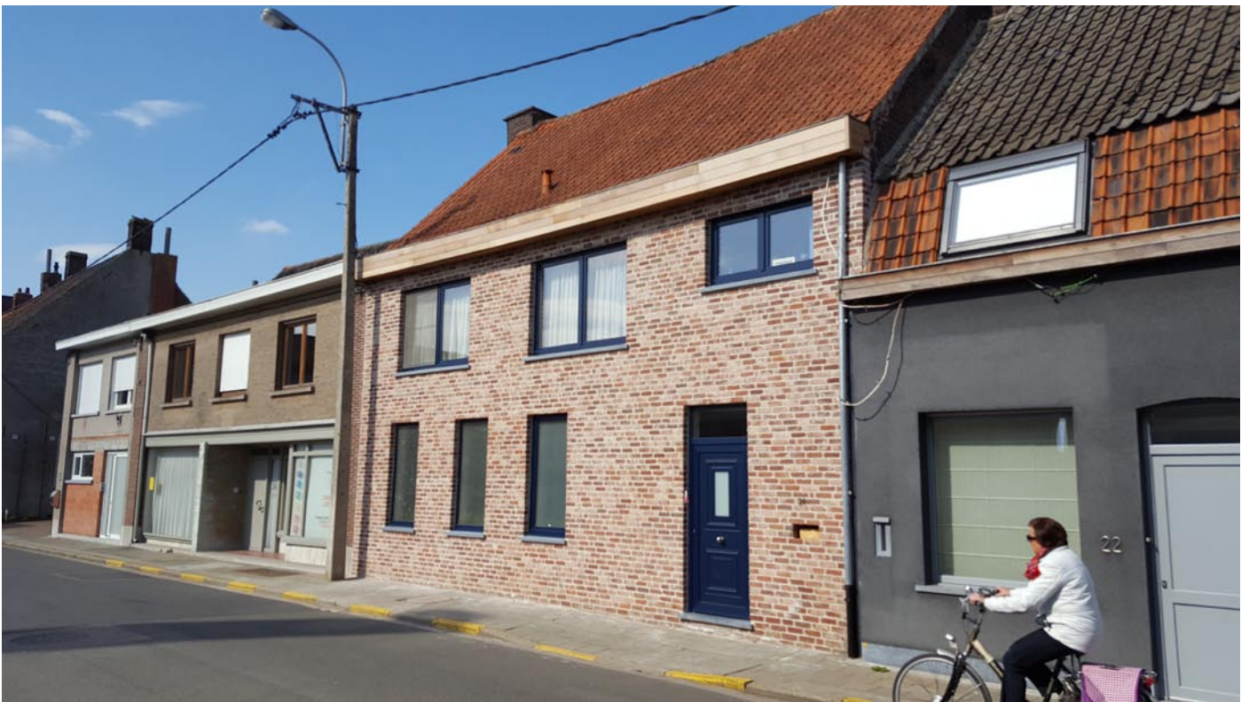
Sint-Jozef - anno 2017 . Rechts van Sint-Jozef café De Trombone. Links, twee huizen verder, café Het Zwaard